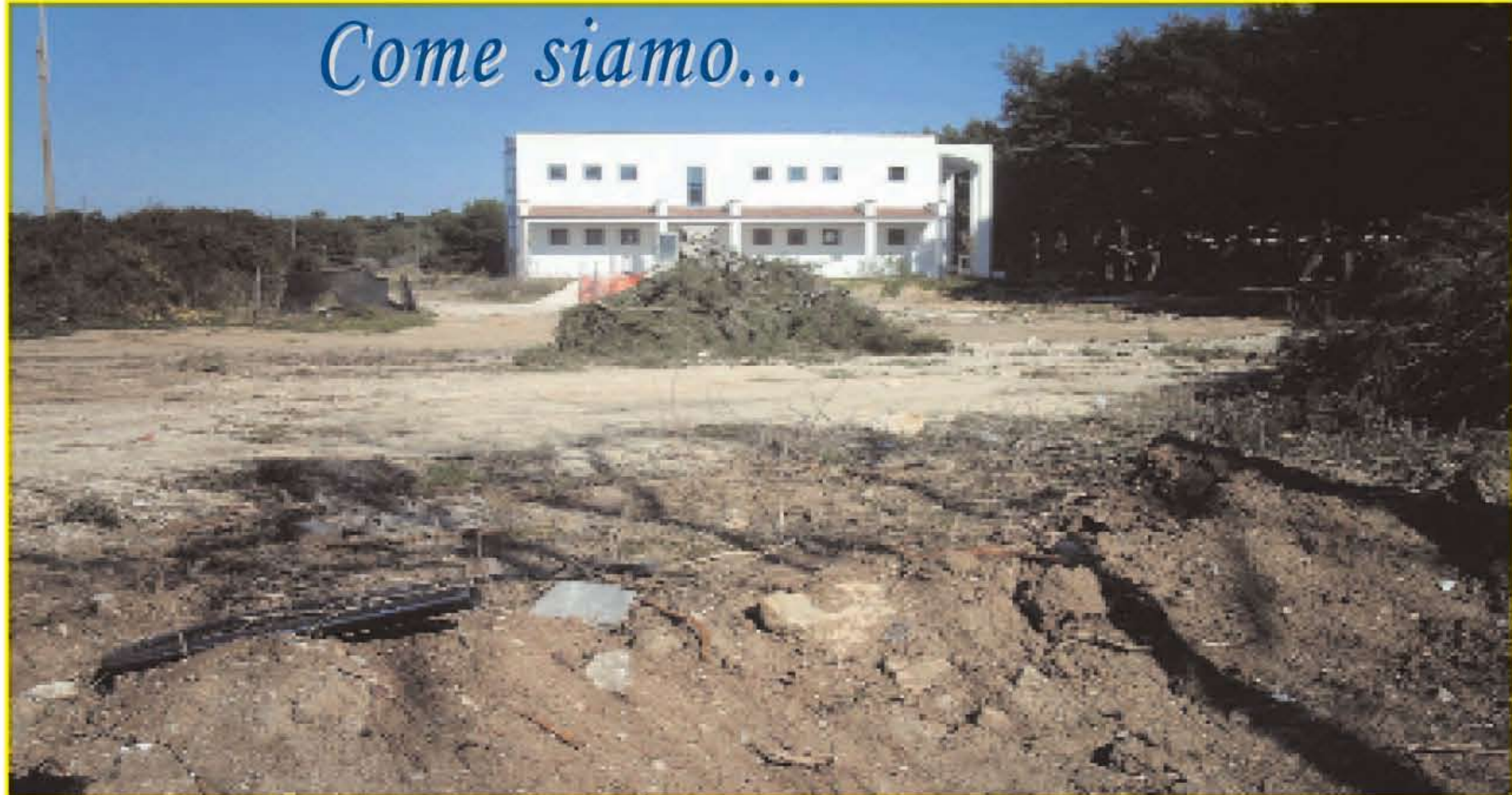
2007 stesso spazio ora utilizzato come cantiere edile...che nostalgia...