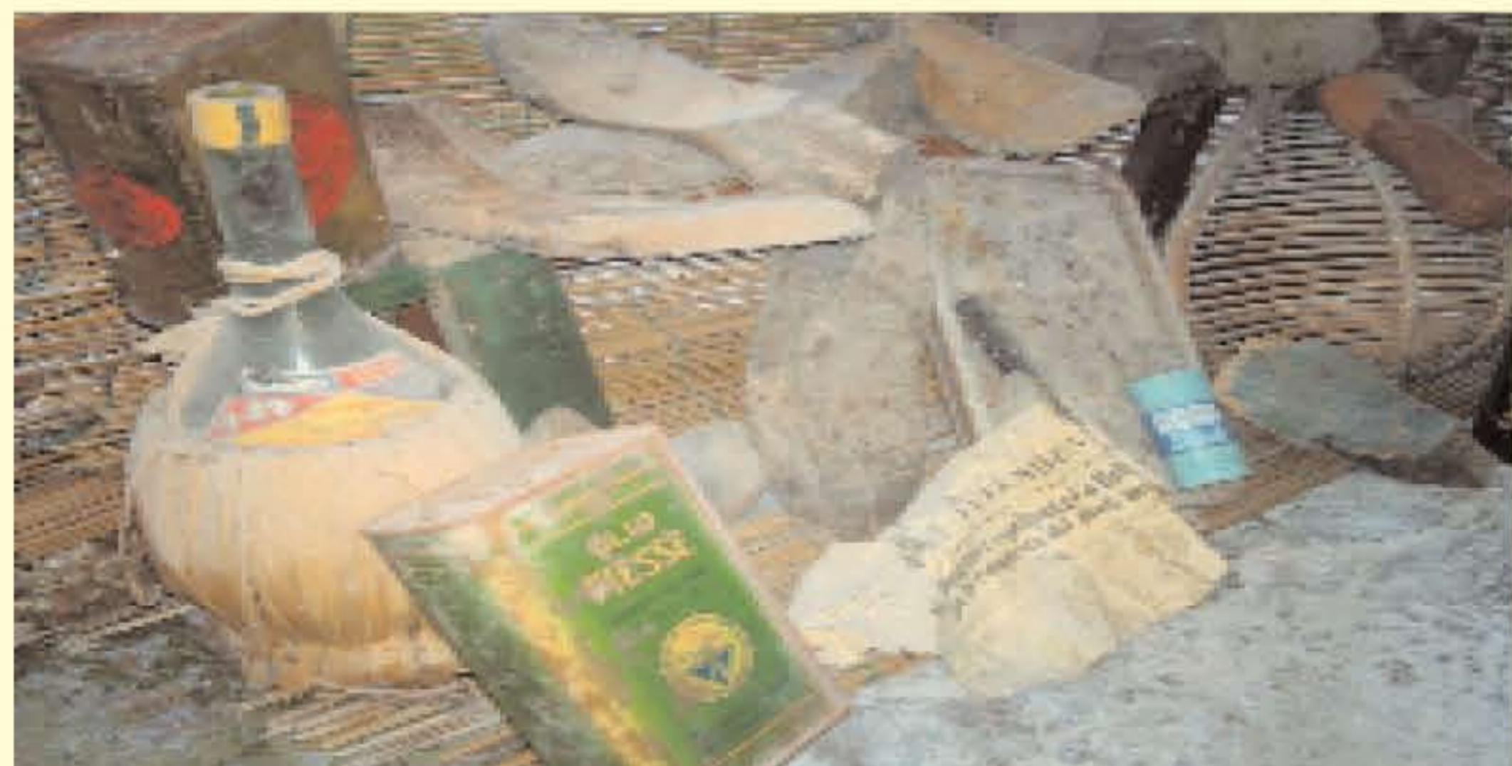
Gli strumenti del "Sorcetto"...